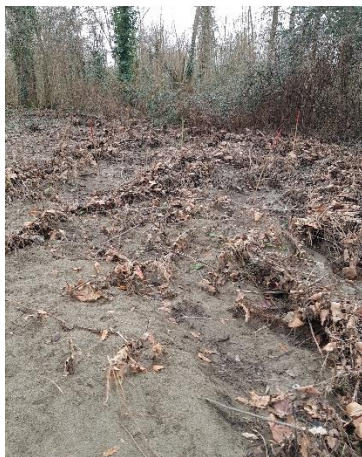
et après la crue...