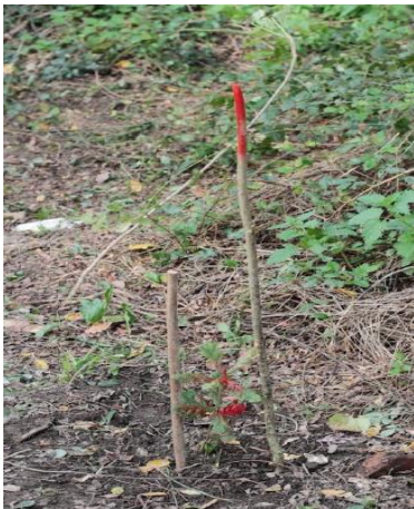
Jeunes plants matérialisés avant...

Toujours actifs, les étudiants du lycée Jean Monnet continuent les travaux de transplantation d'espèces. Les crues de l'Adour ne les découragent pas... et pourtant de nombreux dégâts sont encore constatés