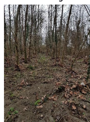
La plantation de frênes : même les ronces n'ont pas survécu ; des tas de sable en surface

Et ces inondations ont eu des effets néfastes sur l'environnement : des déchets de toute nature, de toute taille, venant sans doute de déchetteries enfouies, se sont retrouvés accumulés sur les parcelles. Une journée citoyenne de nettoyage sera programmée.