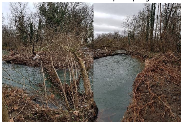
d'importants embâcles et des arbres en travers