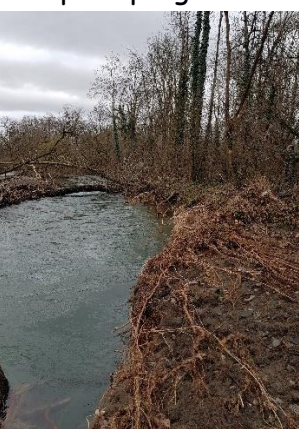
la berge « défoncée »