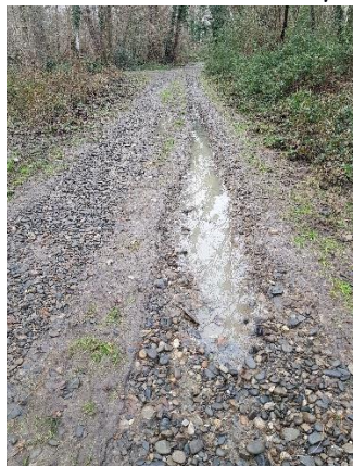
Le chemin raviné

Le 10 décembre 2021, l'Adour sortait de son lit et n'a pas épargné notre forêt et ses berges